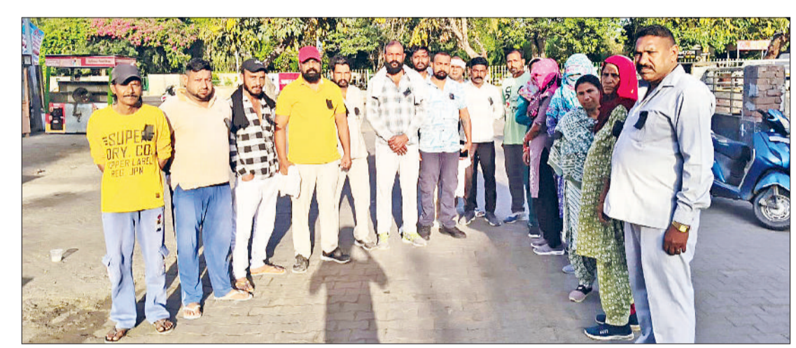
फतेहाबाद। मांगों को लेकर काले बिल्ले लगाकर रोष जताते नगरपरिषद कर्मचारी।

हरियाणा सरकार द्वारा मानी गई मांगों को लागू न करने और लगातार बढ़ती वादाखिलाफी से प्रदेश के नगर पालिका कर्मचारियों में भारी रोष व्याप्त है। नगर पालिका कर्मचारी संघ, हरियाणा के आह्वान पर फतेहाबाद ब्लॉक के सफाई कर्मचारियों और अन्य कर्मियों ने सरकार के विरुद्ध मोर्चा खोल दिया।