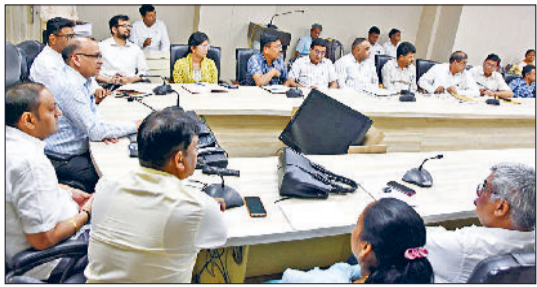
फतेहाबाद। जनगणना को लेकर आयोजित बैठक की अध्यक्षता करते हुए डीसी।