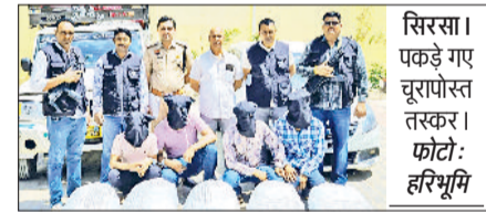
सिरसा। पकड़े गए चूरापोस्त तस्करी।