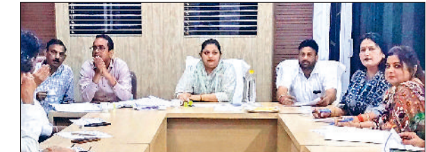
भूना। नगर पालिका की हाउस की मीटिंग में सर्वसम्मति से कचरा निस्तारण प्लांट के खिलाफ प्रस्ताव पारित करते हुए।