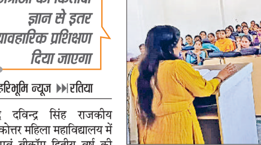
टीम वर्क सहित अन्य बातों की दी जानकारी