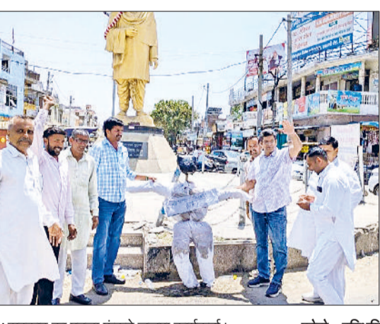
चोपटा। सरकार का पुतला फूँकते जजपा कार्यकर्ता।