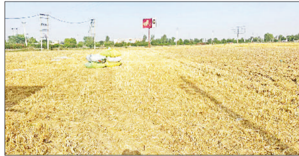
फतेहाबाद। गेहूं कटाई के बाद खाली पड़े खेत।

यानी इस बार करीब 21 हजार क्विंटल अधिक गेहूं मंडियों में आया है। इस बार पिछले साल से ज्यादा आवक होने से किसान मालामाल हो रहे हैं। विशेषज्ञों का मानना है यह 15 साल का रिकार्ड है जब गेहूं उत्पादन ज्यादा रहेगा। इस बार जिले में 4 लाख 6 हजार 608 एकड़ में गेहूं की बिजाई हुई थी। बार बार बदलते मौसम व मंधी में पश्चिमी विक्षोभ आने से इस बात का डर था कि गेहूं उत्पादन में कमी आएगी लेकिन गेहूं पकने तक मौसम किसानों के अनुकूल रहा और अंत तक तेज धूप से गेहूं का फायदा मिला। यही कारण है कि इस बार पिछले साल से ज्यादा गेहूं की