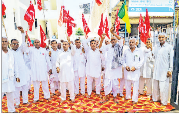
भड़कलां। मार्केट कमेटी कार्यालय के बाहर प्रदर्शन करते किसान।