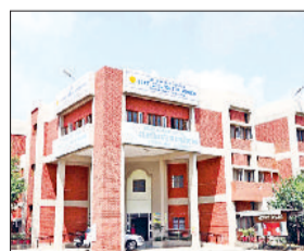
राजकीय महिला महाविद्यालय भोडियाखड़ा।

इस वर्ष 12वीं कक्षा पास कर कॉलेज में प्रवेश के इच्छुक विद्यार्थियों के लिए अच्छी खबर है। उच्चतर शिक्षा विभाग ने सत्र 2026-27 के लिए कॉलेजों में दाखिले का विस्तृत शेड्यूल जारी कर दिया है। है। इस बार पूरी दाखिला प्रक्रिया ऑनलाइन पोर्टल के माध्यम से होगी जिसमें पंजीकरण से लेकर फीस जमा करने तक सभी चरण शामिल हैं। विभाग ने सभी छात्रों को सलाह दी है कि वे निर्धारित तिथियों का विशेष ध्यान रखें और समय पर आवेदन प्रक्रिया